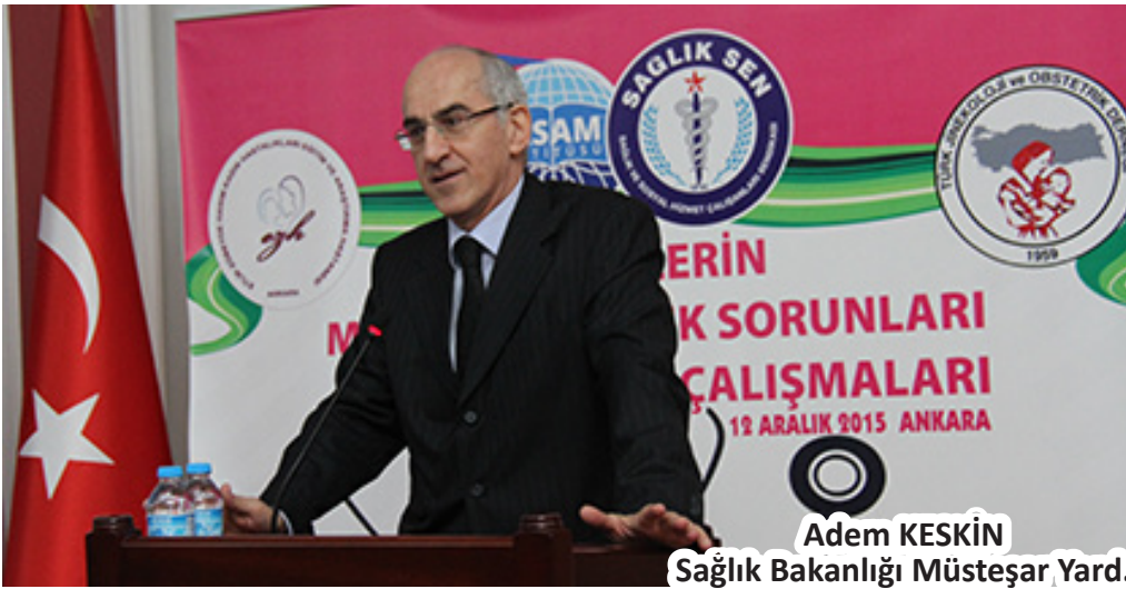
Adem KESKİN Sağlık Bakanlığı Müsteşar Yard.