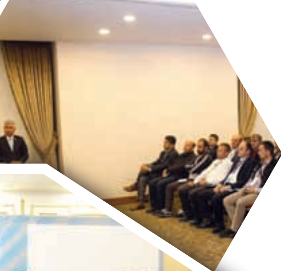
Şube Başkan Yardımcıları (Teşkilatlanma) Toplantısı