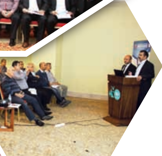
Şube Başkan Yardımcıları (Mali İşler) Toplantısı

Başkanlar Kurulu Toplantısı Sonuç Bildirisi için akıllı telefonunuzdan kare kodu okutunuz.