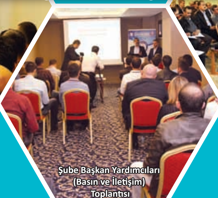
Şube Başkan Yardımcıları (Basın ve İletişim) Toplantısı