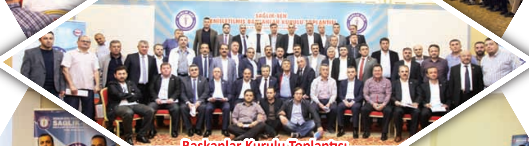
Başkanlar Kurulu Toplantısı