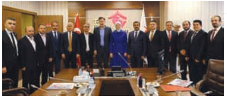
SENDİKAMIZDAN AİLE VE SOSYAL POLİTİKALAR BAKANI DR. SEMA RAMAZONOĞLU'NA ZİYARET