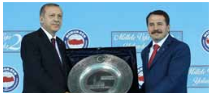
Programın sonunda Memur-Sen Genel Başkanı Ali Yalçın, Cumhurbaşkanı Recep Tayyip Erdoğan'a, içinde Mehmet Akif İnan'ın şiirlerinin bulunduğu Mescid-i Aksa işlemeli plaket hediye etti.

Memur-Sen'in millete vefa yolunda 20. yılını kutlamak için bir araya geldiklerini vurgulayan Yalçın, sözlerini şu şekilde sürdürdü: "Biz, milletimize, ülkemize, ümmete ve insanlığa vefadan hiç vazgeçmedik. Hiç vazgeçmeyeceğiz. Ümmetin, mazlum ve mağdurların vefa beklentisine hiç kulak tıkamadık, hiçbir zaman sırt dönmedik/dönmeyeceğiz. "Dünya Beşten Büyüktür" haykırışını hissiyatımızın ve isyanımızın ifadesi olarak gördük görmeye devam edeceğiz. 1 Milyon Üye'ye yürüyen Büyük Memur-Sen ailesi adına saygılarımı sunuyorum."