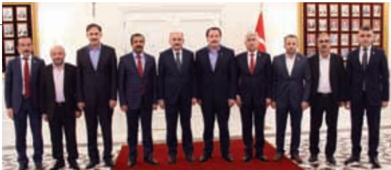
SENDİKAMIZDAN SAĞLIK BAKANI DR. MEHMET MÜEZZİNOĞLU'NA ZİYARET